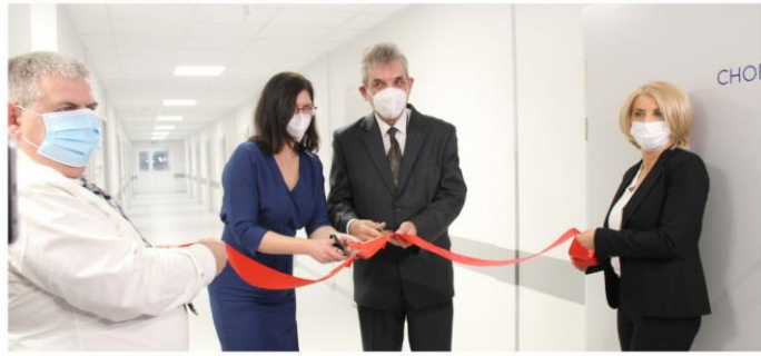
Wojewódzki Specjalistyczny ZZOZ Chorób Płuc i Gruźlicy w Wolicy -podsumowanie 2022r.