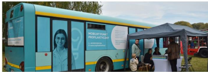
Wojewódzki Specjalistyczny ZZOZ Chorób Płuc i Gruźlicy w Wolicy -konferencje, profilaktyka